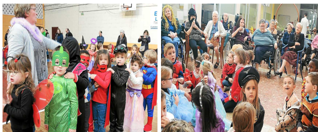
Tous au carnaval 2018 : Joie et couleurs, froid et bonheur !