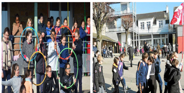
Souvenirs d'une journée « Jeux Olympiques d'hiver ».

Merci à tous les partenaires qui pilotent ce projet, et aux parents qui participent à l'encadrement des enfants pour ce rendez-vous centré sur l'éducation à la santé.